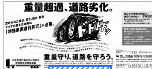
【昨年度掲載】一般紙/地方紙