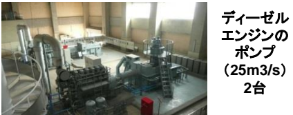
ディーゼルエンジンのポンプ (25m 3 /s) 2台