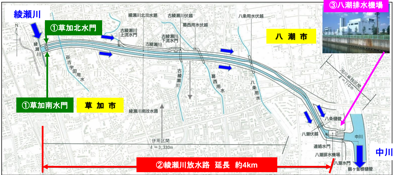
①草加北水門・草加南水門