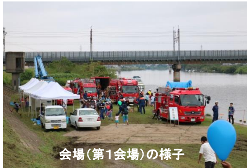
会場(第1会場)の様子

当日はEポートや木製船の出航式典、消防車両放水体験、特産品の販売などが行われ、約2000人が訪れました。