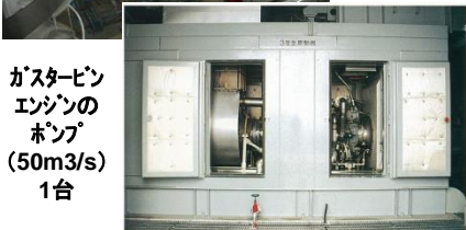
ガスタービンエンジンのポンプ (50m 3 /s) 1台

中川の水位が低い場合は自然流下しますが、水位が高い場合は八潮排水機場のポンプによって排水します。