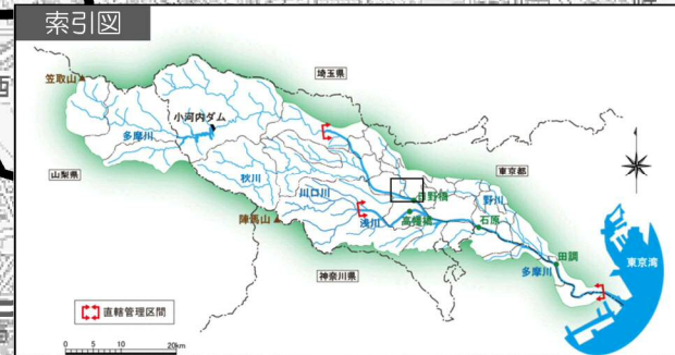
多摩川水系多摩川、浅川、大栗川洪水浸水想定区域図 (家屋倒壊等氾濫想定区域(河岸侵食))

1 説明文 (1) この図は、多摩川水系多摩川、浅川、大栗川の洪水予報及び水位周知区間について、家屋倒壊等をもたらすような氾濫の発生が想定される区域(家屋倒壊等氾濫想定区域)を表示した図面です。 (2) この家屋倒壊等氾濫想定区域は、現時点の多摩川、浅川、大栗川の河道の整備状況を勘案して、想定最大規模降雨に伴う洪水により多摩川、浅川、大栗川の河岸の浸食幅を予測したものです。 (3) また、家屋倒壊等氾濫想定区域(河岸侵食)は、多摩川、浅川、大栗川の河岸が侵食された場合における、家屋の倒壊・流出等の危険性がある区域の目安を示すものですが、個々の家屋の構造・強度特性等の違いから、この区域の境界は厳密ではなく、あくまで目安であることに留意してください。