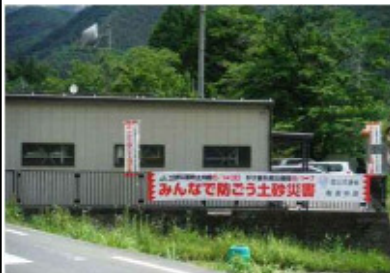
早川出張所 横断幕設置状況