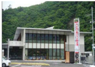
早川町役場 横断幕設置状況