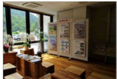
早川町役場 パネル設置状況