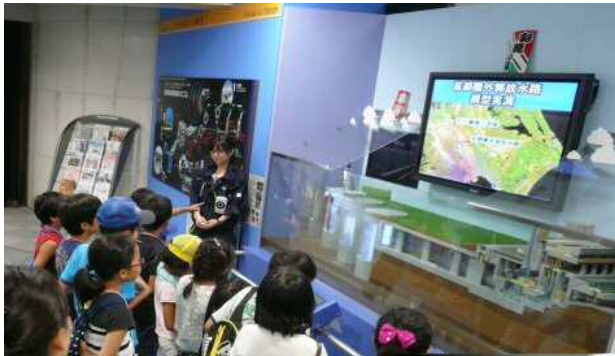
模型や映像を使用した説明