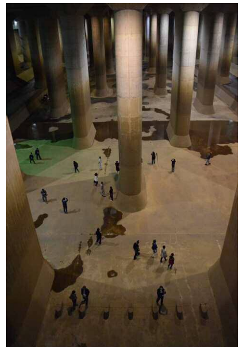
ひんやり涼しい地下の調圧水槽