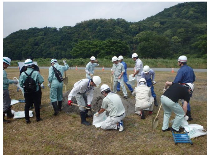
きそぎじゆつ 基礎技術：最もよく使う土のうの作り方を学んでいます