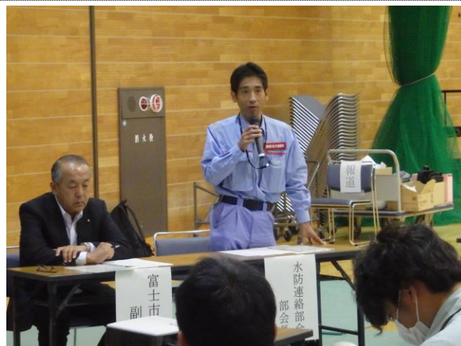
甲府河川国道事務所 尾松所長 挨拶