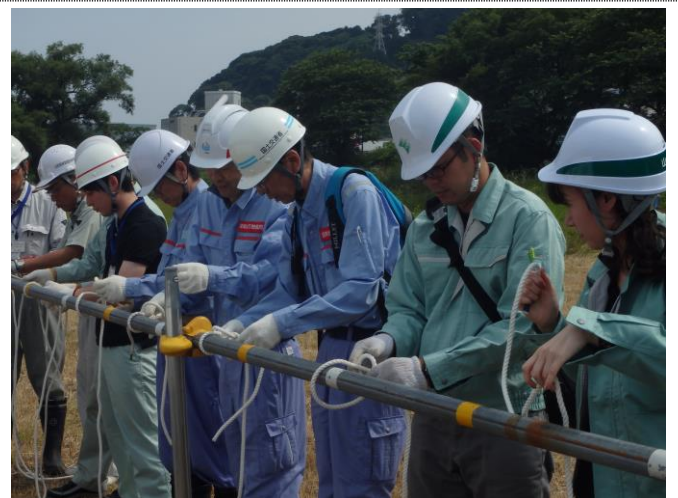
きそぎじゆつ きながしこう 基礎技術：木流し工などに使う、様々な縄結びの方法を学んでいます