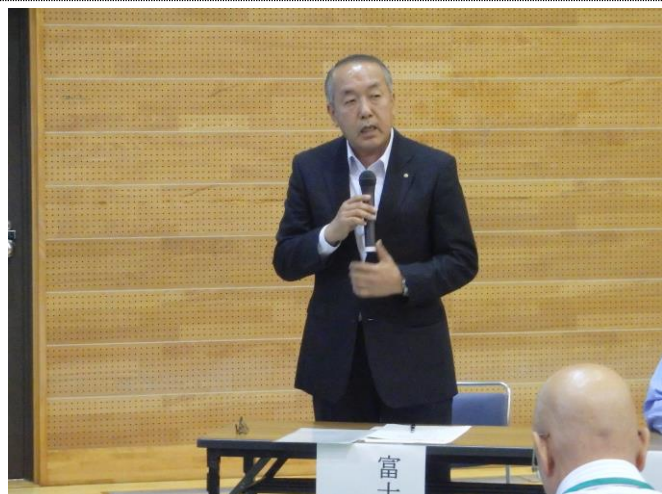
富士市 仁藤副市長 挨拶