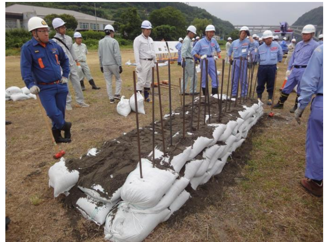
すいほうこうほう つみとのうこう 水防工法：積み土のう工の方法を学んでいるところです