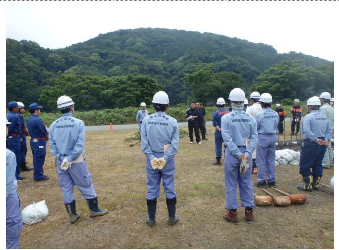
水防訓練講師による講評及び閉講式