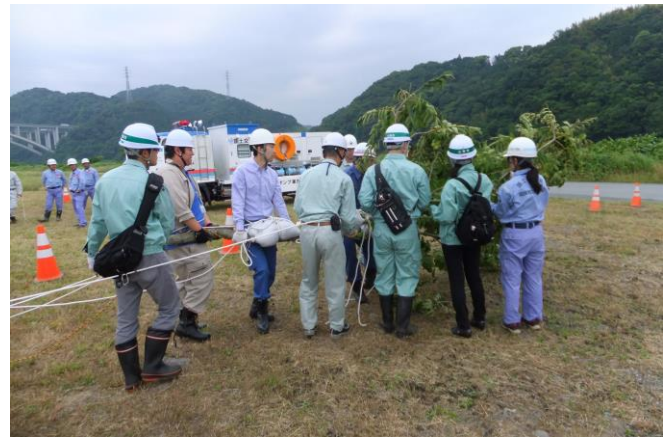
すいほうこうほう きながしこう 水防工法：木流し工の方法を学んでいるところです。