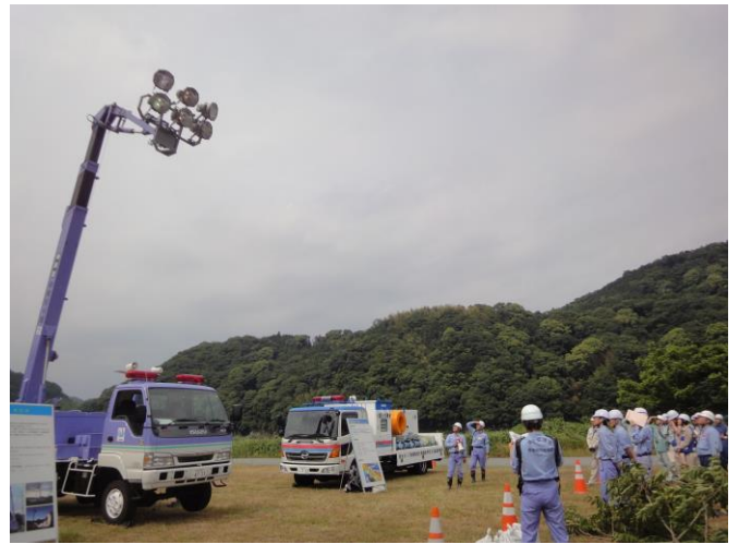
さいがいじ 災害時に使用するポンプ車・照明車の説明を受けています