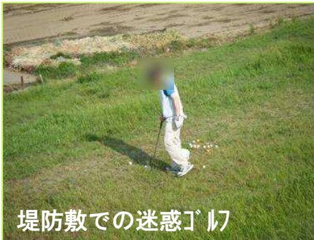
堤防敷での迷惑ゴミ