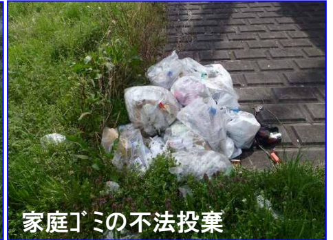
家庭ゴミの不法投棄