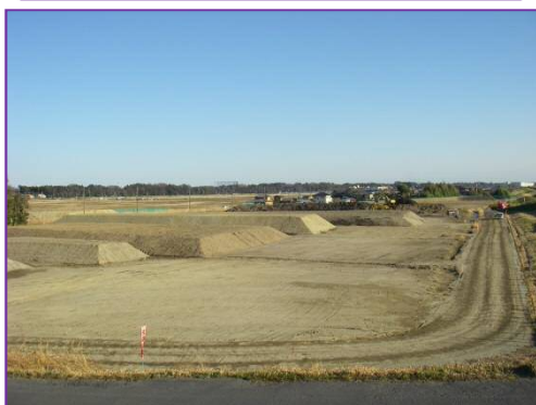
流山建設発生土ストックの状況 【千葉県流山市深井新田地先】

土砂改良工事とは、性状の違う複数の建設発生土を有効活用するため、土砂改良(攪拌混合)を行い、工事に必要な土砂の生産や、建設発生土ストックの維持管理を行います。建設発生土ストックについては、前号参照。