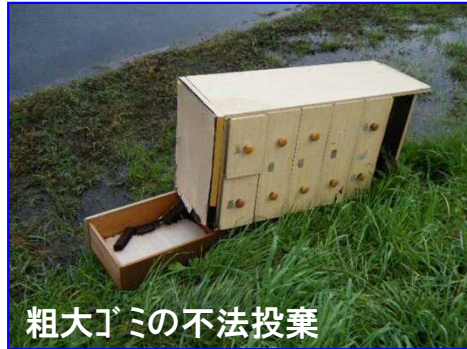
粗大ゴミの不法投棄

平成27年度に報告件数が一番多かったのは、ごみ等の不法投棄で、粗大ゴミが約5割、次いで家庭ゴミが約3割(左下円グラフ)の結果を受けて、本年度も引き続き巡視員による巡視(指導)を徹底強化していきます。