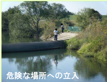
危険な場所への立入

二番目は、危険な利用形態で、迷惑ゴミが約5割、次いで危険な場所への立入が約3割(右下円グラフ)の結果を受けて、関係自治体(占有者)や警察署と連携を図りながら、巡視(指導)を徹底強化していきます。