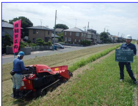
江戸川の堤防除草作業の状況(H27)