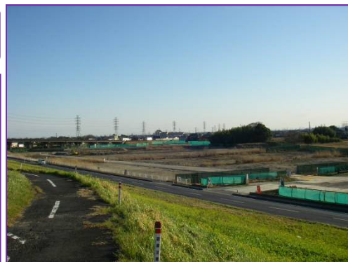
吉川建設発生土ストックの状況 【埼玉県吉川市鍋小路地先】