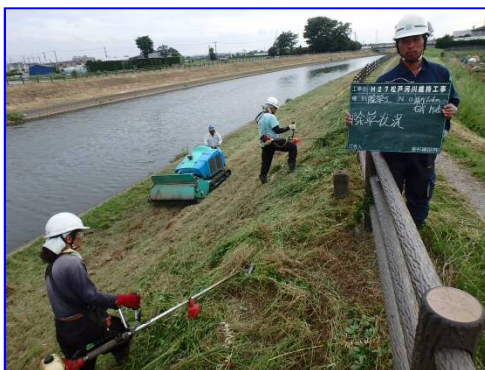
坂川の堤防除草作業の状況(H27)

出水(台風)期前の5月末までに、松戸出張所管内の江戸川と坂川の堤防除草を行います。作業は、大型連休(GW)明けの5月9日から開始する予定となっております。ご理解とご協力をお願いいたします。