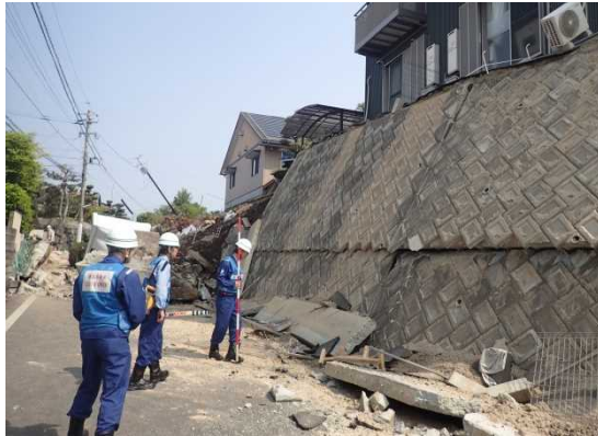
ましきまち みやぞの ＜益城町宮園地先 10時頃 道路陥没状況調査＞