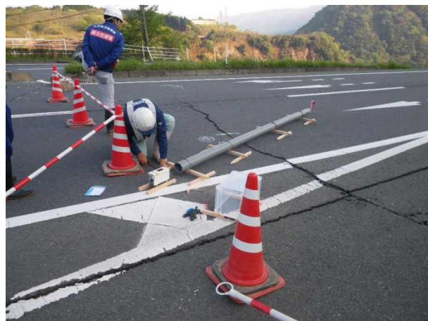
みなみあそむら たての ＜南阿蘇村立野地先 18時頃 伸縮計設置状況＞