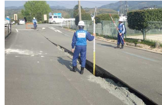
ましきまち たらさこ ＜益城町寺迫地先 16時頃 道路陥没状況調査＞