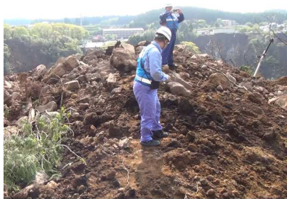
みなみあそむら たての ＜南阿蘇村立野地先 9時頃 斜面崩落状況調査＞