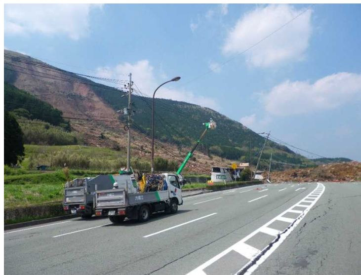
みなみあそむら たての ＜南阿蘇村立野地先 斜面崩落状況＞