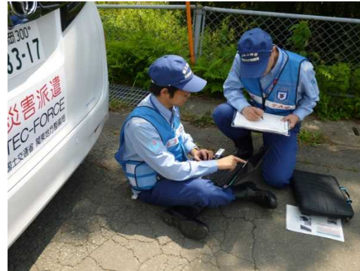
ましきまち ＜益城町 12時頃 調査とりまとめ状況＞