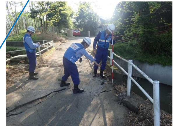
ましきまち たらさこ ＜益城町寺迫地先 16時頃 道路損壊状況調査＞