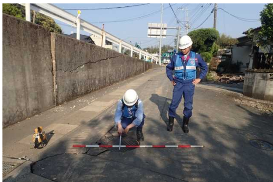
ましきまち たらさこ ＜益城町寺迫地先 17時頃 道路陥没状況調査＞