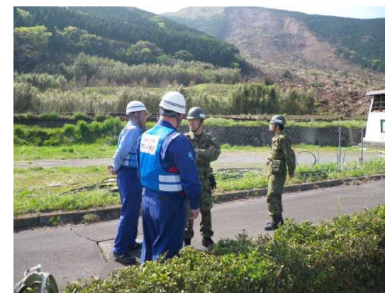
みなみあそむら たての ＜南阿蘇村立野地先 15時頃 斜面崩落状況調査(自衛隊との話し合い)＞