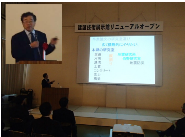
藤野教授による講演