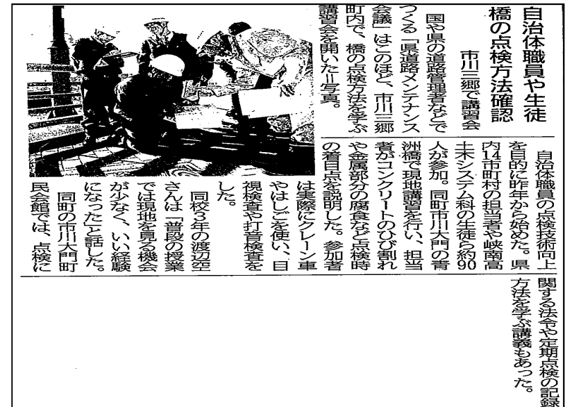
(山梨日日新聞 (平成27年12月1日))

※)H27.11.24「NHKニュース(山梨)」、「NHKまるごと山梨」、「UTYニュースの星」、「YBSワイドニュース」で放映、H27.12.1山梨日日新聞に記事掲載