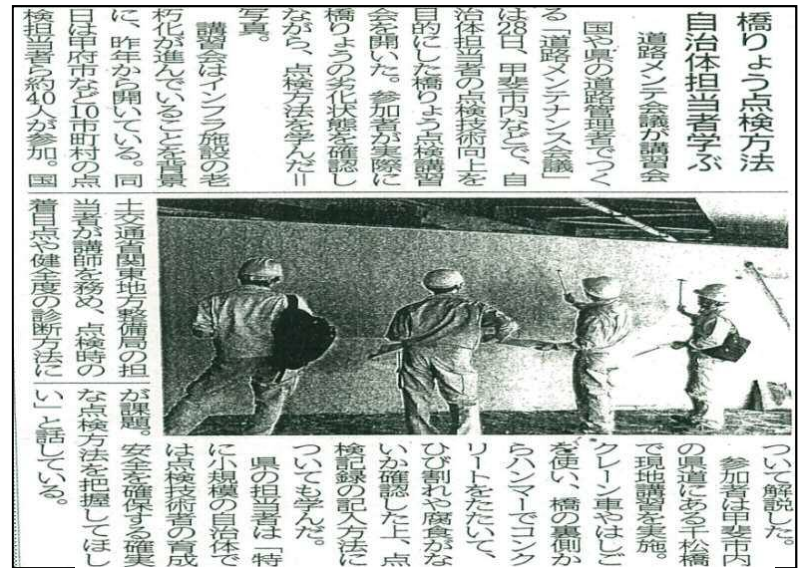
(山梨日日新聞 (平成27年10月29日))

※)H27.10.28「YBSワイドニュース」、「UTYニュースの星」、「NHKまるごと山梨」で放映 H27.10.29山梨日日新聞に記事掲載