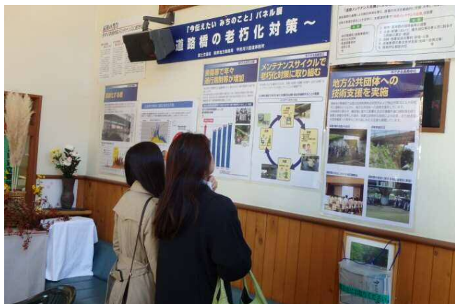
道の駅「みとみ」にて