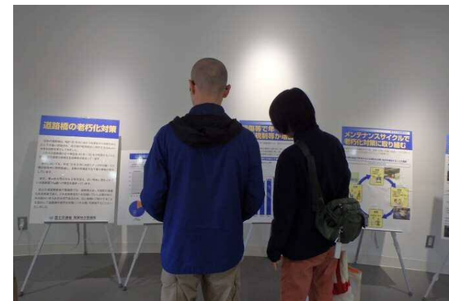
道の駅「こすげ」にて