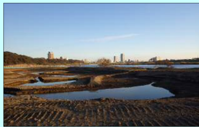
柳原地区 掘削後状況