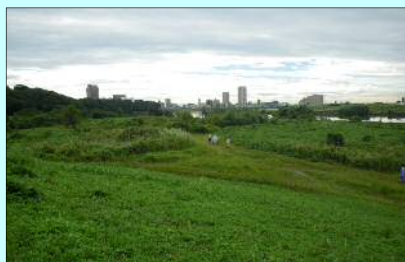
柳原地区 掘削前状況