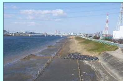
高谷地区 1月末時点