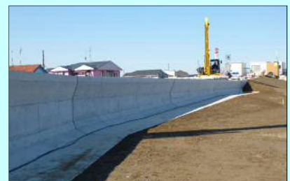
パラペットの状況