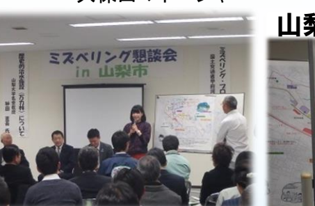
横浜からフェリス女学院大 の学生も参加！