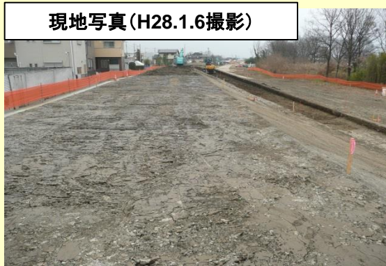
中川下流側から上流側に向けて撮影