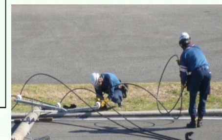
H26訓練：電力会社(占有者)によるケーブル撤去