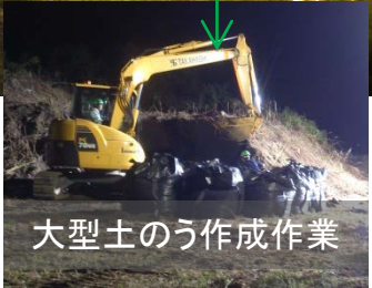
大型土のう作成作業