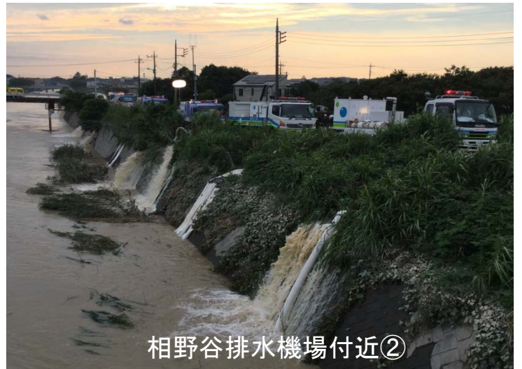
相野谷排水機場付近②