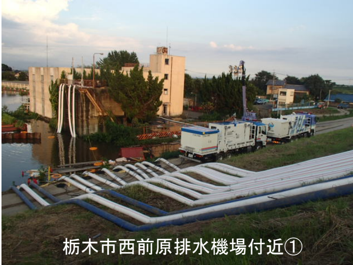
栃木市西前原排水機場付近①