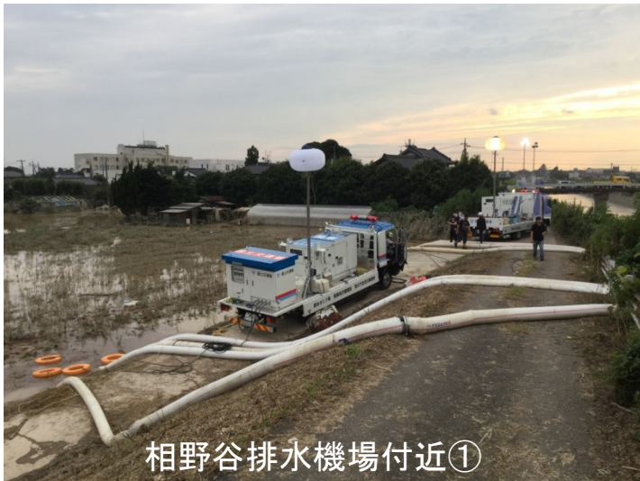
相野谷排水機場付近①