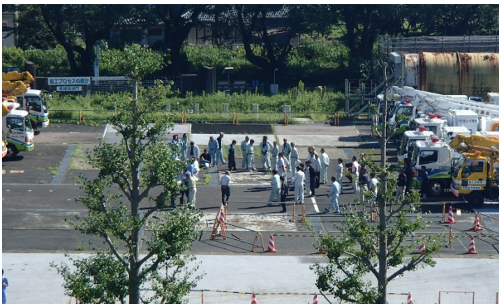
関東技術事務所が他の整備局の災害対策用機械の中継基地として活用された