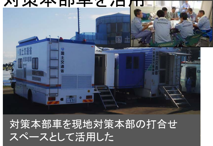
対策本部車を現地対策本部の打合せスペースとして活用した