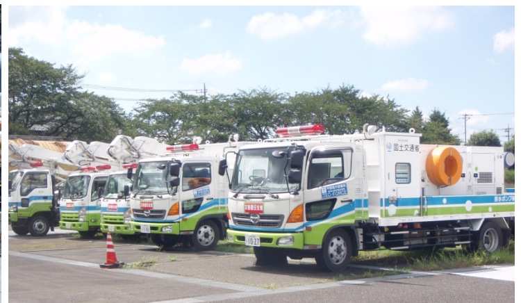
他の地方整備局の災害対策用機械