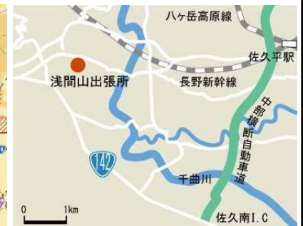
浅間山砂防だより