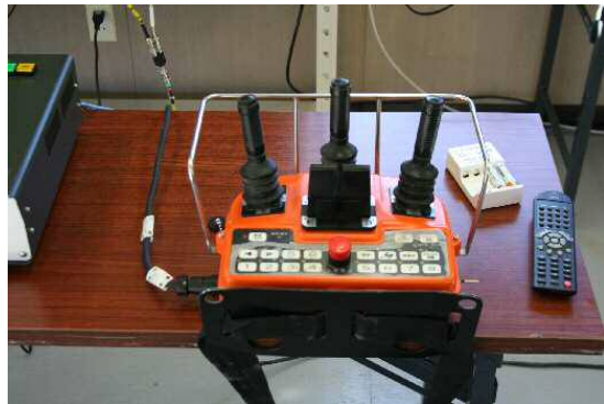
遠隔操作の操作盤

バックホウはモニターとマシンガイダンス（掘削状況を断面で確認できる装置）を使用して掘削と埋め戻しを行っています。