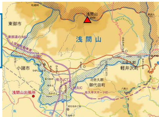
浅間山出張所案内図