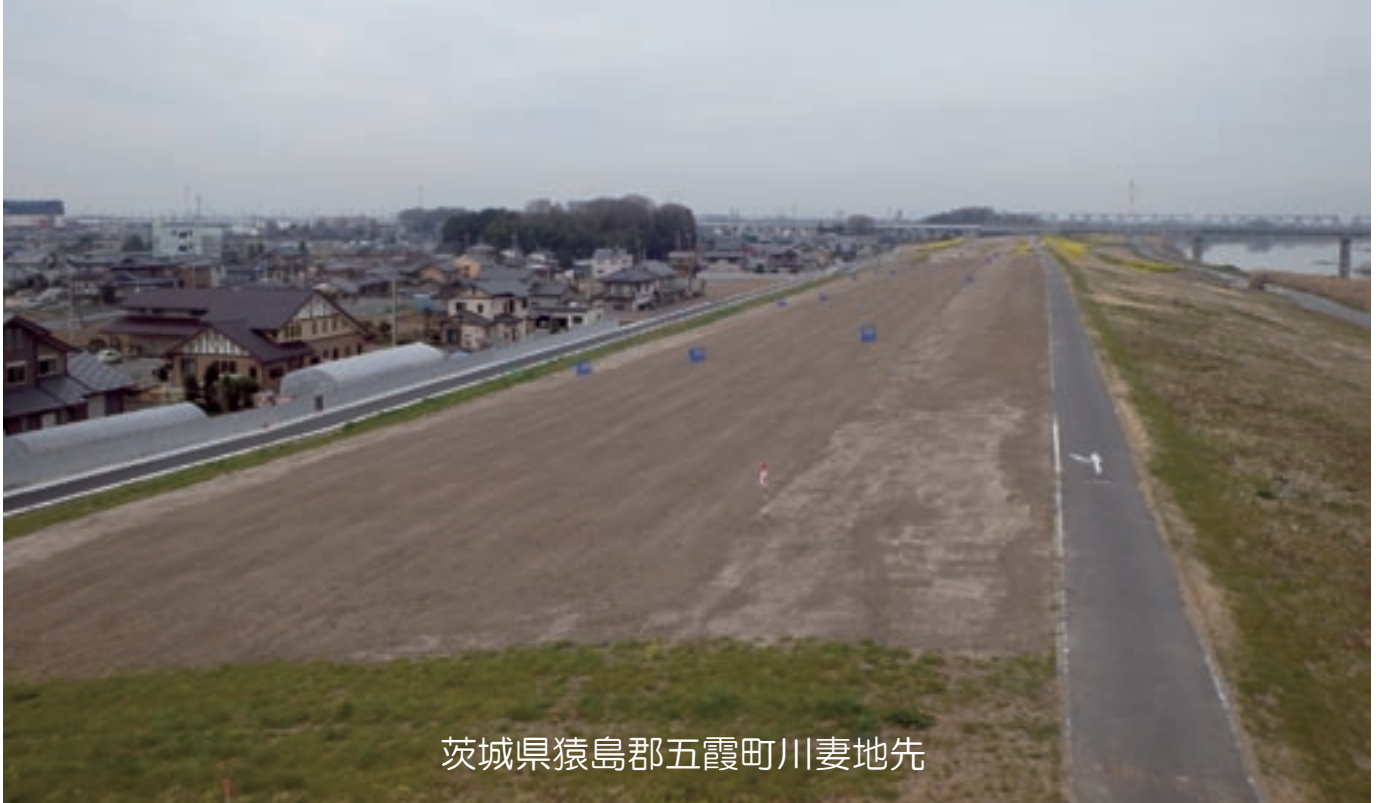
茨城県猿島郡五霞町川妻地先

利根川では、過去に堤防基盤からの漏水や堤防の斜面崩壊等が発生しています。また、利根川が決壊するとその被害が首都圏まで及び甚大な被害が想定されることから堤防強化対策として堤防の拡幅を行っています。