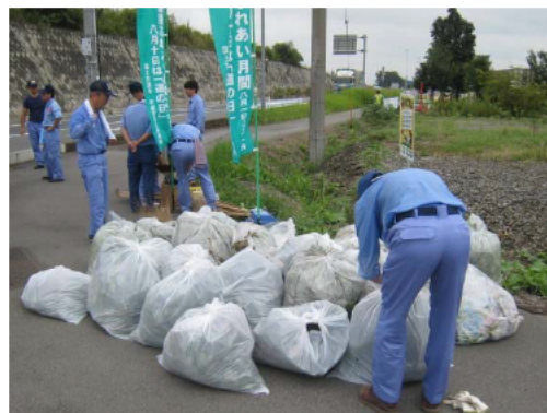
◇ 8月21日(金) 国道新4号 (下野市薬師寺地先) ・薬師寺交差点、周辺歩道の清掃