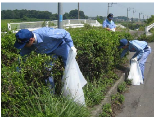
◇ 8月5日(水) 国道50号 (結城市小田林地先) ・小田林西交差点、周辺歩道の清掃