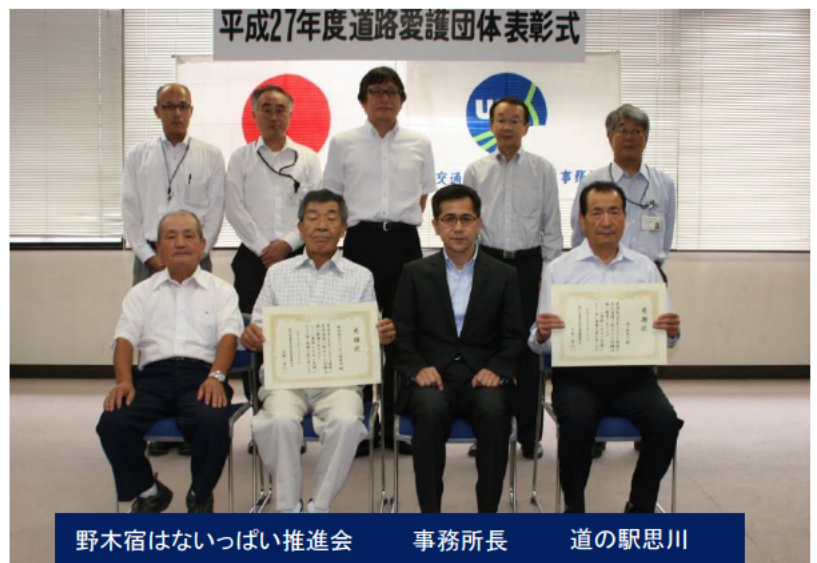
野木宿はないっぱい推進会 事務所長 道の駅思川

国道4号の野木交差点周辺の植樹帯の清掃、並びに緑化活動を平成22年から行って頂いています。