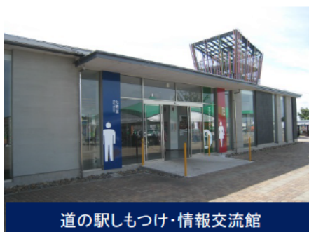
道の駅しもつけ・情報交流館

「道の駅しもつけ・情報交流館」において、平成27年7月30日(木)から8月11日(火)の間、「道の日」記念イベントとして、栃木土木事務所、下野市と合同でパネル展を行い、宇都宮国道事務所では、道路橋の老朽化対策のパネルを展示しました。