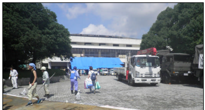
水海道総合体育館へ支援物資を届ける