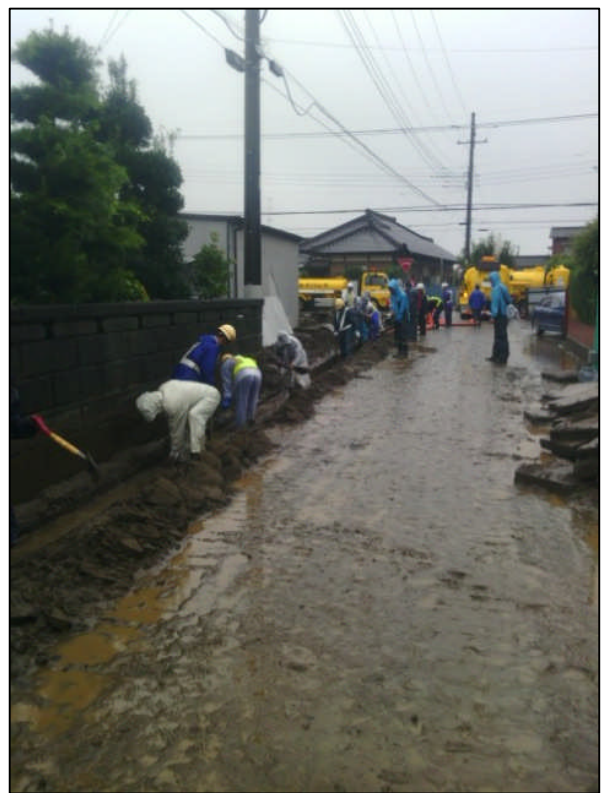
道路側溝清掃作業【関東地整】実施状況（常総市三坂町：9/17 14時）