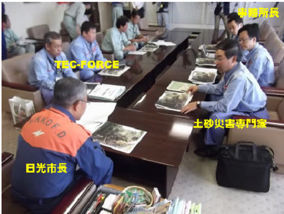
日光市長へ TEC-FORCE 及び土砂災害専門家による調査結果を報告