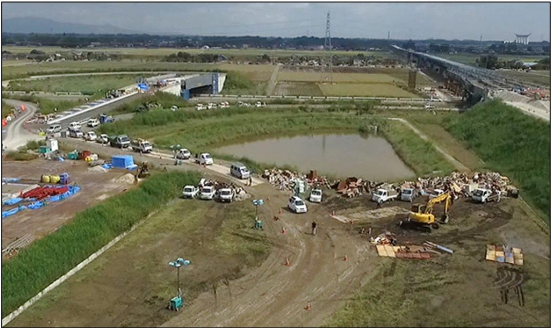
圏央道（建設中） 常総 I C 予定地への粗大ゴミ受け入れ