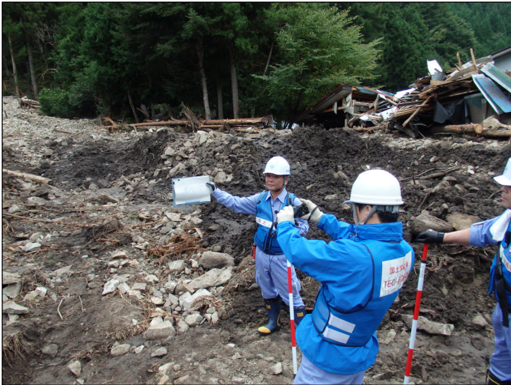
土石流の被害状況を調査する TEC-FORCE 隊員（日光市滝向沢）