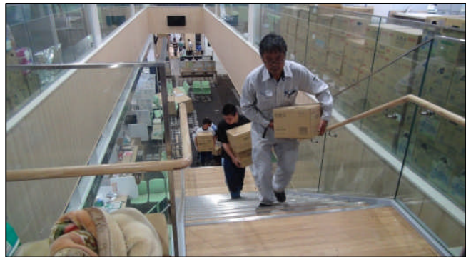
常総市役所へ支援物資を届ける