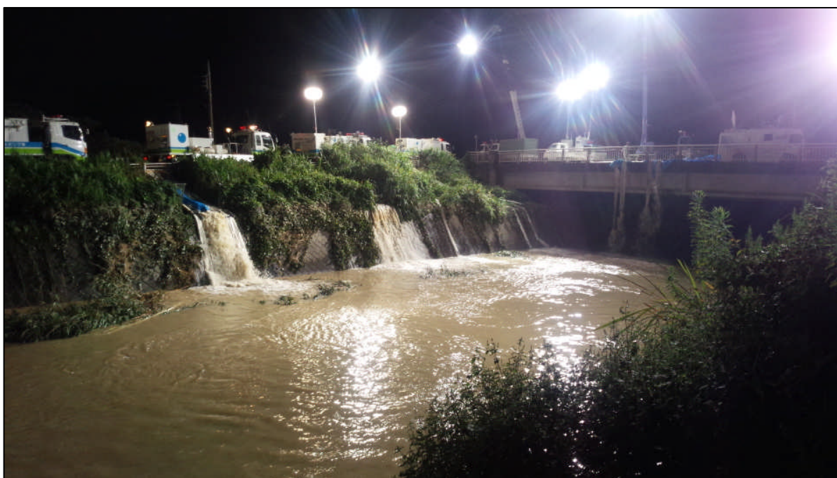
排水作業を24時間実施するため「照明車」を設置