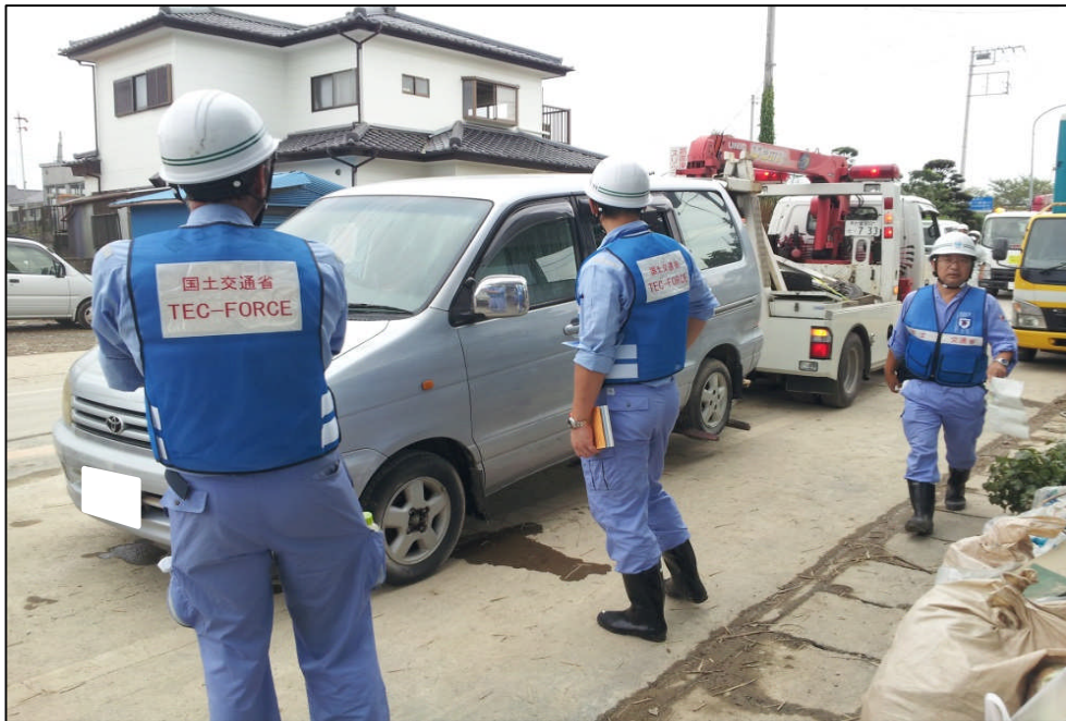
緊急車両の通行を確保するため、常総市道に放置された車両の移動を行う道路の啓開作業