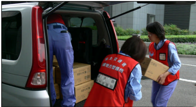
支援物資を関東地方整備局（さいたま新都心合同庁舎）から搬出