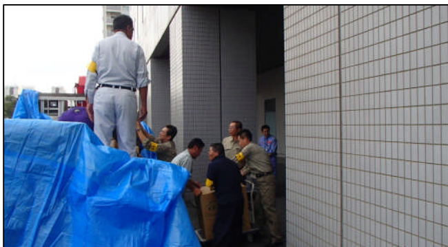
支援物資を関東地方整備局（横浜第二合同庁舎）から搬出