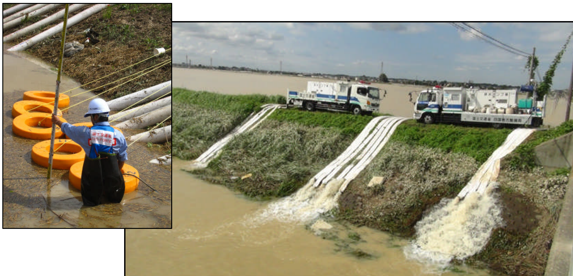
浸水した地域にて「排水ポンプ車」を用いて排水作業を実施