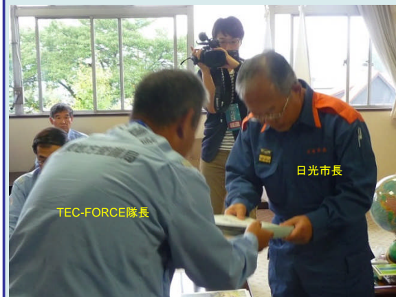
日光市長への報告書の提出