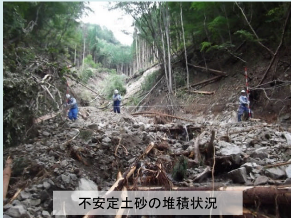
不安定土砂の堆積状況