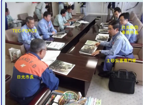
日光市長への説明状況