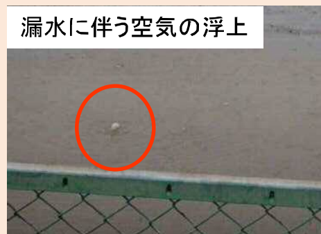
漏水に伴う空気の浮上