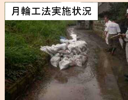
月輪工法実施状況