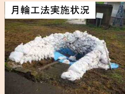
月輪工法実施状況