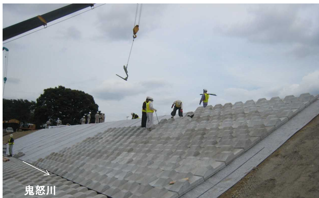
法覆工の施工状況（川表側より下流から上流をのぞむ）