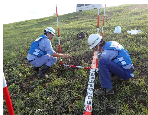
(茨城県常総市大輪町地先(鬼怒川右岸16.5km付近))15時45分 撮影