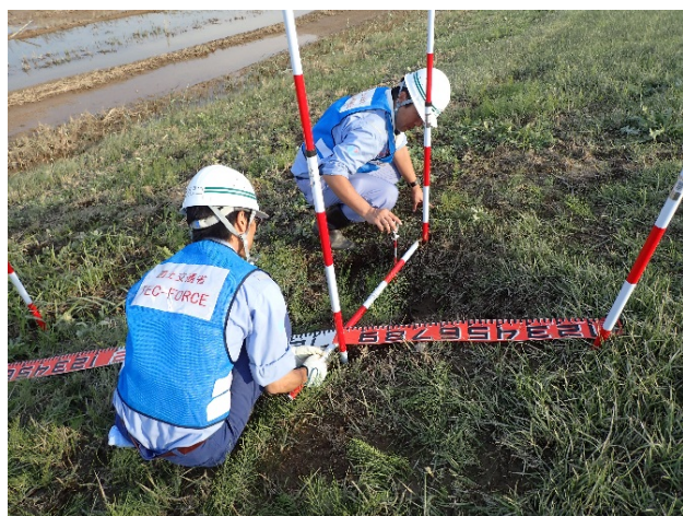
(茨城県常総市大輪町地先(鬼怒川右岸16.5km付近))15時45分 撮影