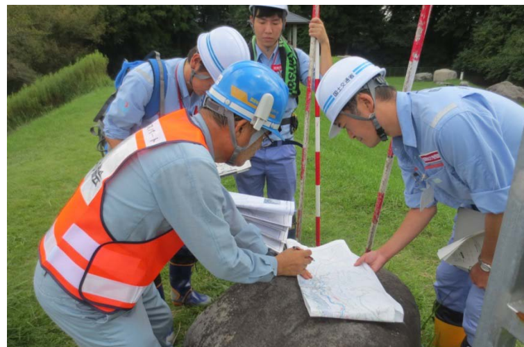
(茨城県市守谷市大山新田地先(鬼怒川左岸5.2km))11時撮影