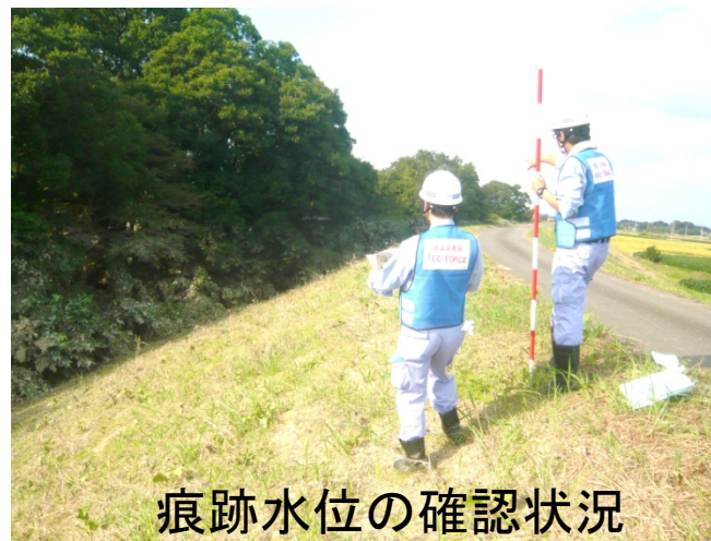
痕跡水位の確認状況