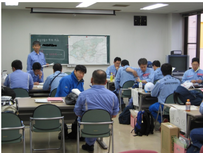
現地調査事前打ち合わせ6時撮影