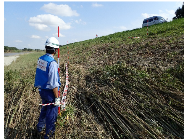
(茨城県常総市羽生町地先(鬼怒川右岸14.75km付近))15時撮影