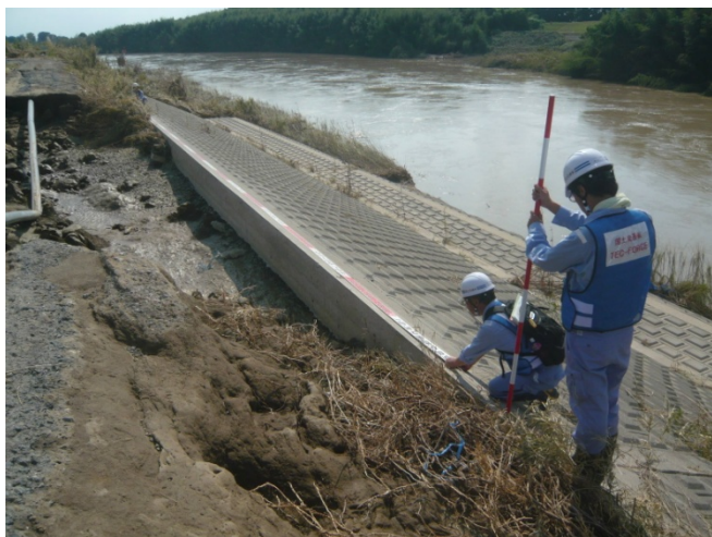
(茨城県下妻市尻手地先(鬼怒川左岸36.1km))14時撮影