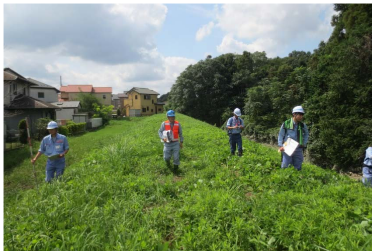
(茨城県守谷市松前台西地先(鬼怒川左岸4.0km))11時撮影