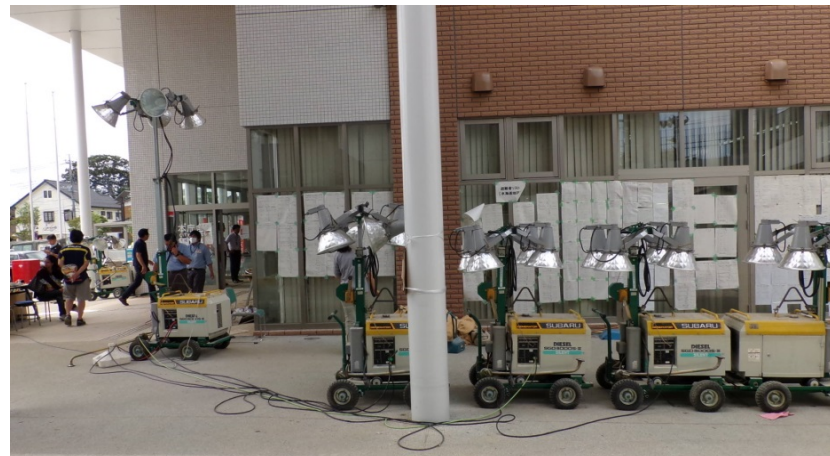
投光器として活用(市役所玄関) 9/14時点