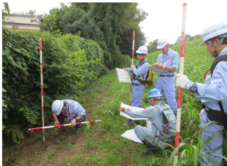
(茨城県常総市高野地先(鬼怒川左岸9.0km))14時撮影