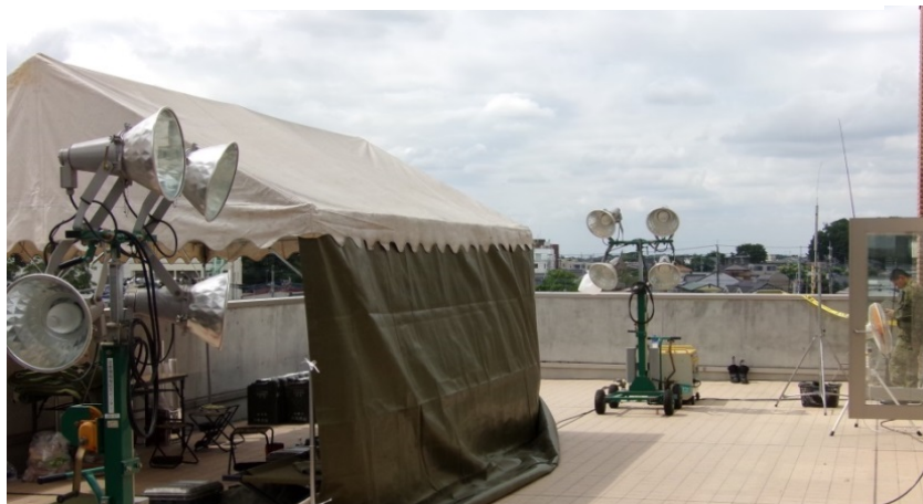
投光器として活用(市役所屋上) 9/14時点