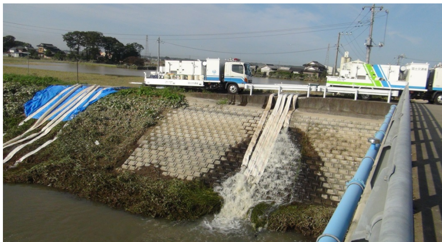
(常総市八間堀地先)