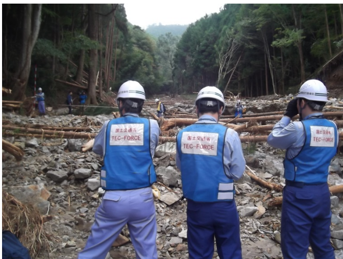
現地調査状況9時撮影