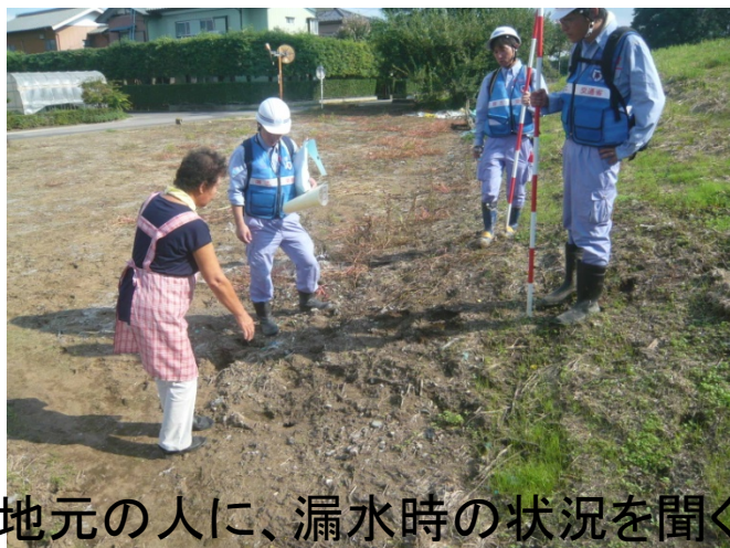
地元の人に、漏水時の状況を聞く