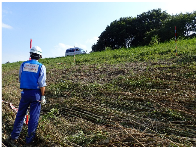
(茨城県常総市羽生町地先(鬼怒川右岸14.75km付近))15時撮影