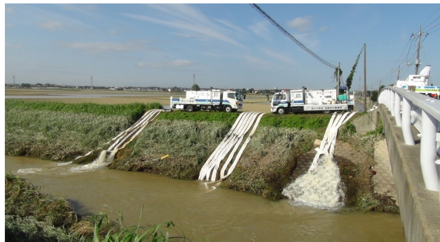
(常総市八間堀地先 上大橋)