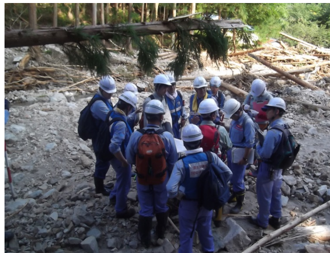
土砂災害専門家の技術指導15時撮影