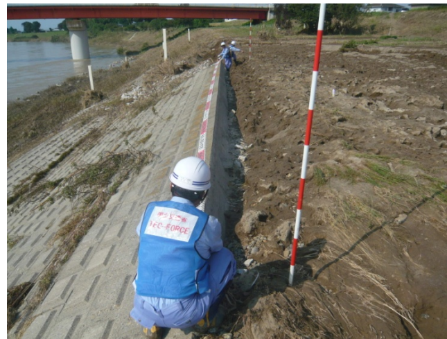
(茨城県下妻市尻手地先(鬼怒川左岸36.1km))14時撮影