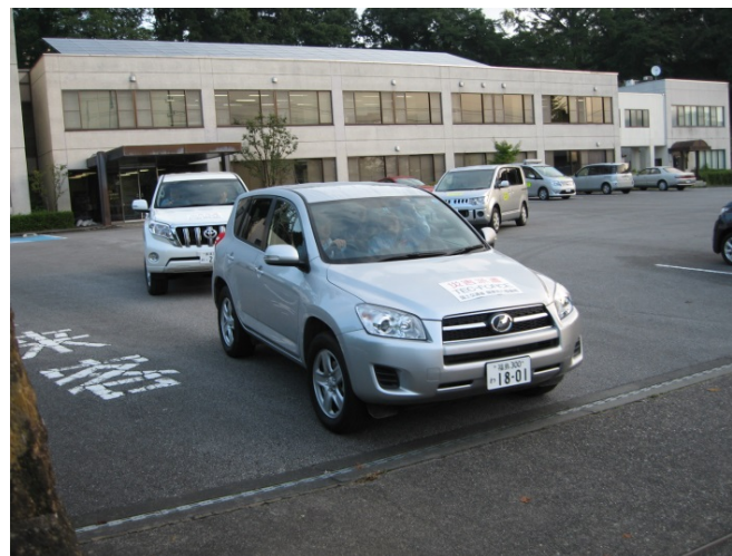
現地調査出発6時15分撮影