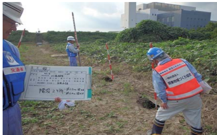
川表暗渠管水路陥没確認