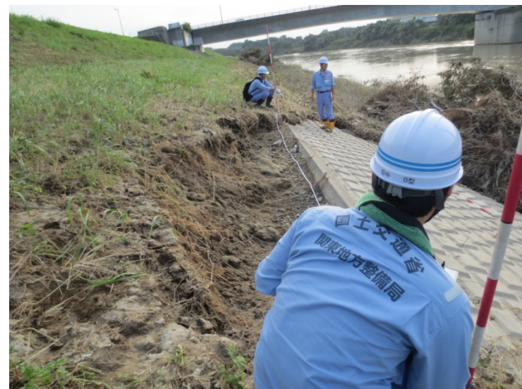
(茨城県常総市小山戸町地先(鬼怒川左岸13.0km))16時撮影