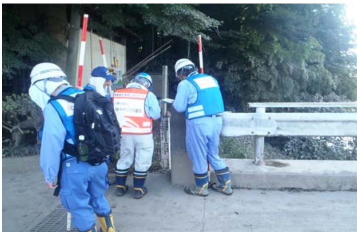
無堤部浸水状況確認