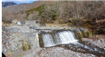
登録有形文化財 「稲荷川第2砂防堰堤」（T9完成）