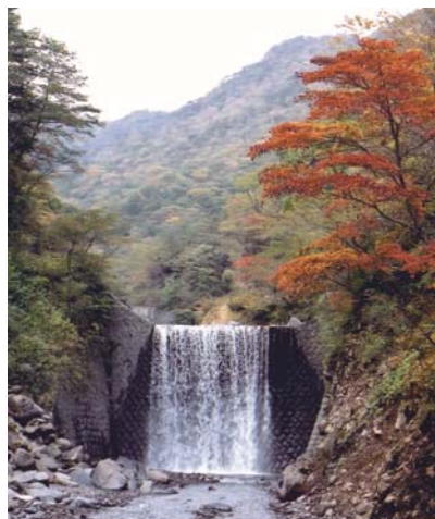
登録有形文化財 「釜ッ沢下流砂防堰堤」（S9完成）