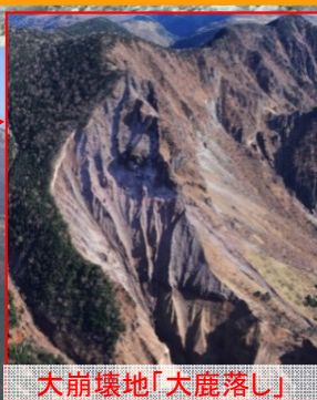
大崩壊地「大鹿落し」