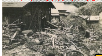
世界遺産を構成する竜光院（重要文化財）の土石流被害