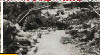
稲荷川流域の山内地区での土石流被害