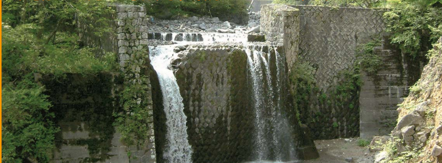
登録有形文化財 釜ッ沢砂防堰堤