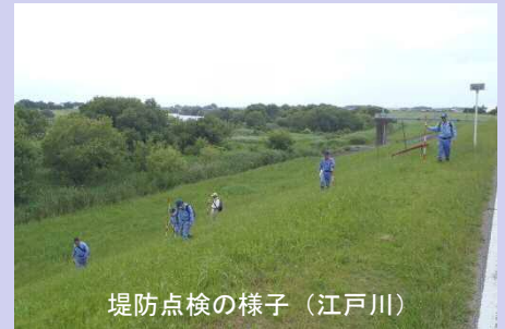
堤防点検の様子（江戸川）