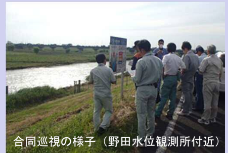
合同巡視の様子（野田水位観測所付近）