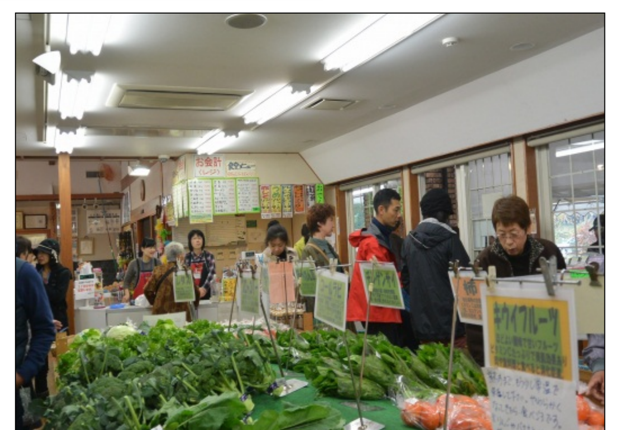
「鳥居原ふれあいの館」では地元産の新鮮な農産品を販売