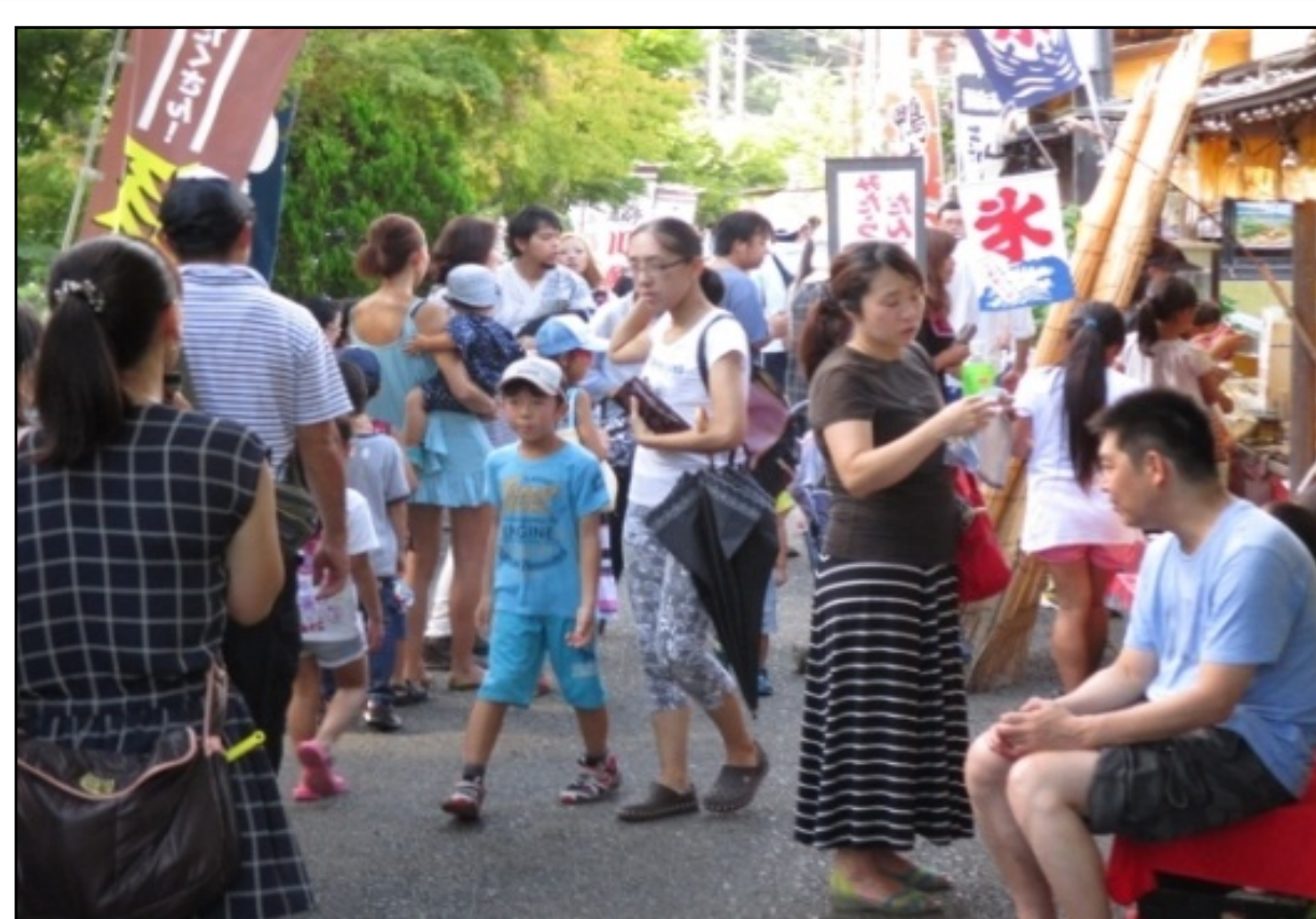
多くの観光客が訪れる「水の郷商店街」