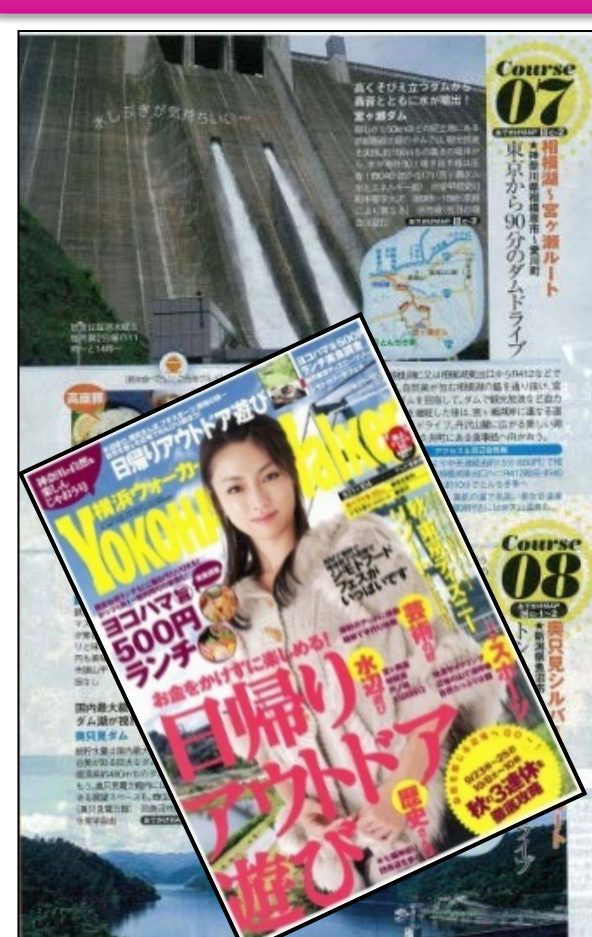
「横浜ウォーカー」2011年NO. 19号/発行: KADOKAWA