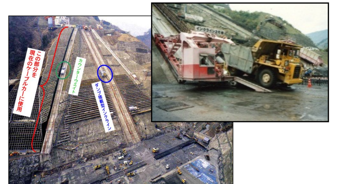
ダム建設時にコンクリートを運搬