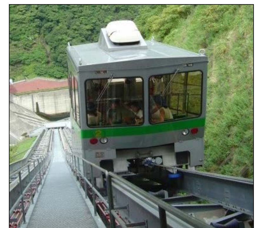
インクラインの一部を観光用ケーブルカーに活用