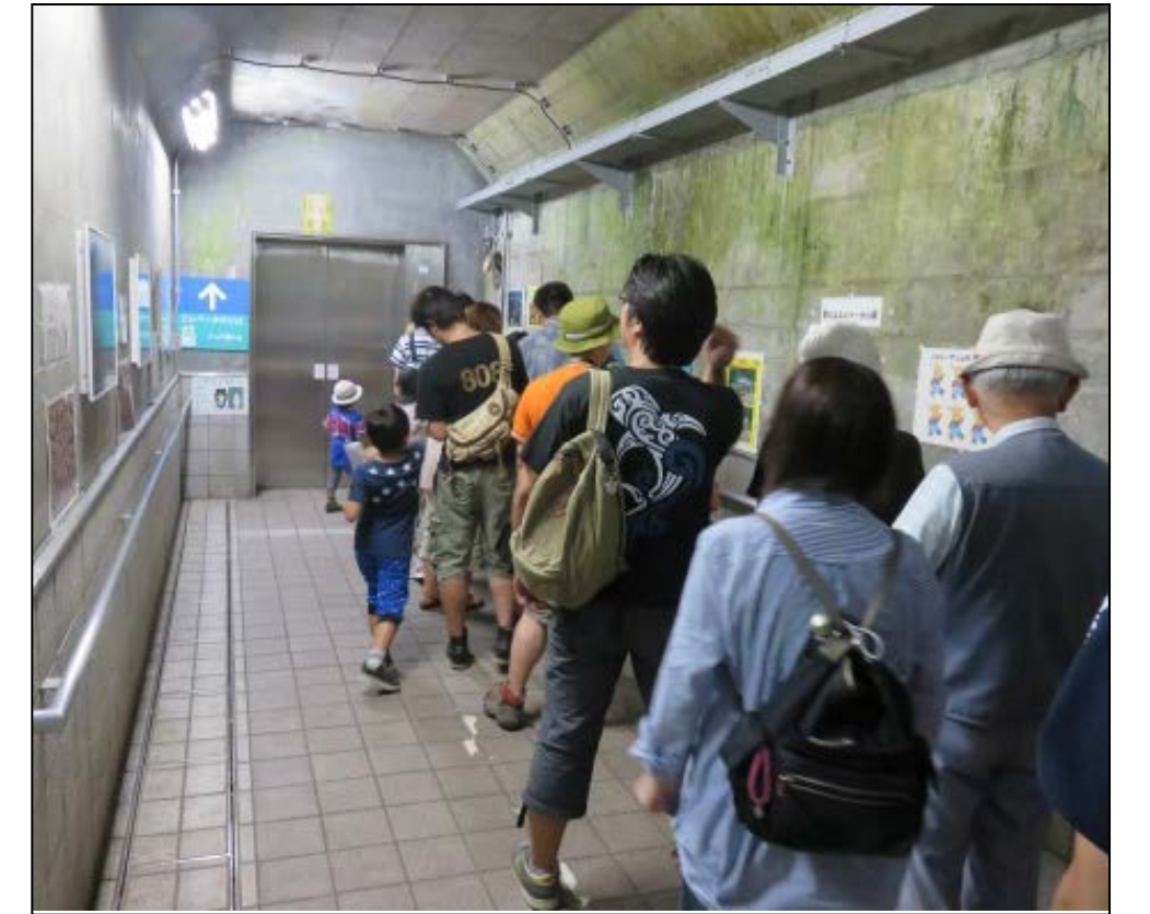
ダム堤体内のエレベータを一般に開放