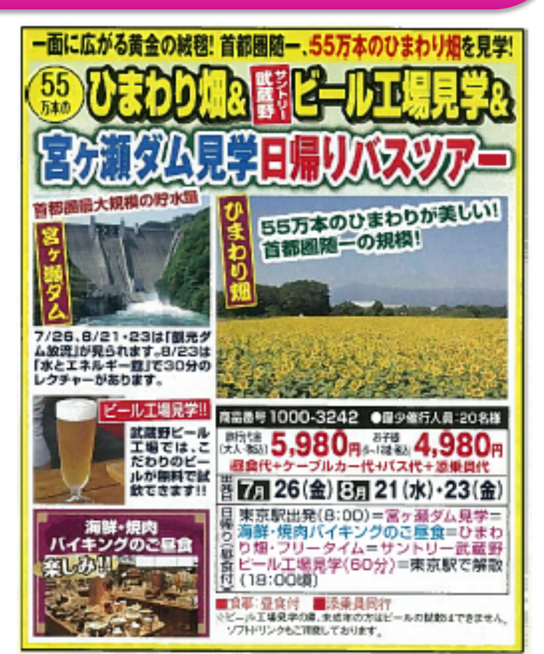
宮ヶ瀬ダムが観光ツアーの目玉に (はけかる倶楽部)