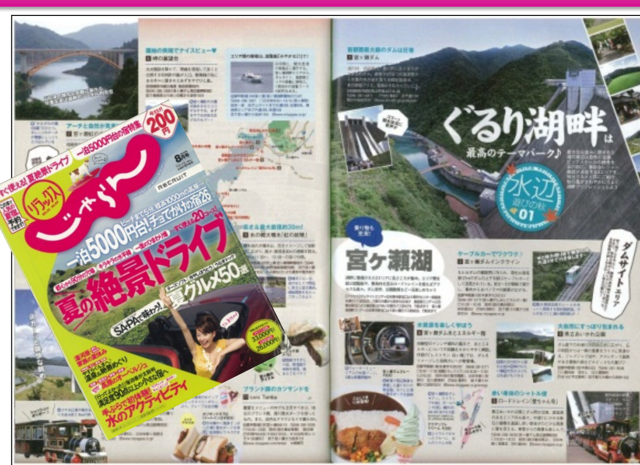
『リラックスじゃらん』2008年8月号