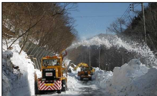
H26.2 (主)水上片品線（みなかみ町地内） ロータリ除雪車による道路拡幅除雪