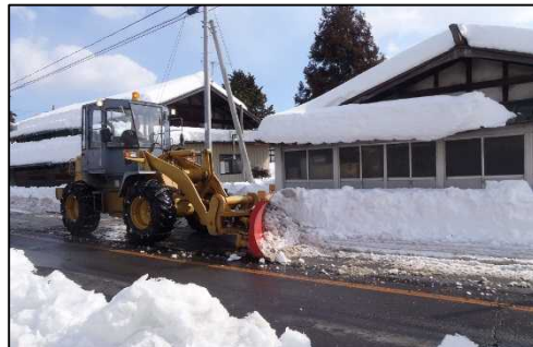
H26.2 (主)沼田水上線（みなかみ町地内） 除雪ドーザによる道路拡幅除雪