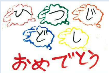
群馬県 黒岩 莉稀 様