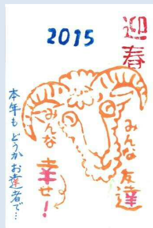
埼玉県 広見 純子 様