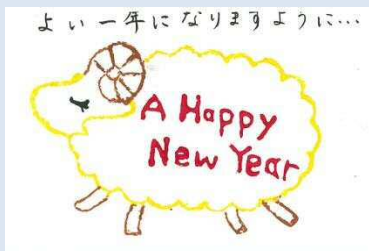
群馬県 黒岩 実枝 様