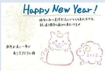
千葉県 山本 由佳 様