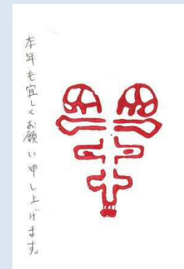
群馬県 田村 千尋 様