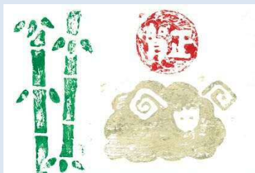
群馬県 黒岩 しづく 様