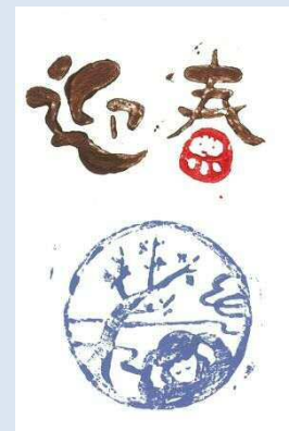
群馬県 黒岩 はづき 様