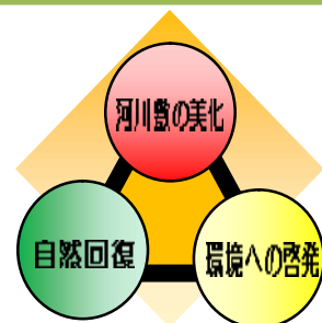
▼荒川クリーンエイドの目的

荒川放水路通水 70 周年（1994 年）を記念して始められ、平成 25 年度で 20 周年を迎えました。開始当初は、年間約 3 千人の参加者でしたが、現在では約 1 万人以上の方々が荒川のゴミ拾いを行っています。