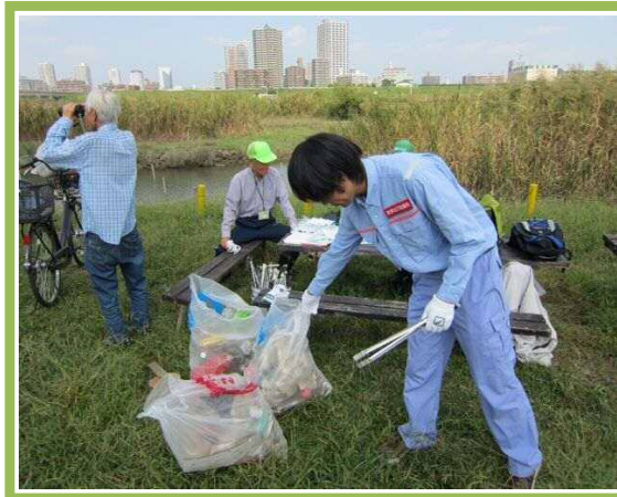
▼実施日:10月11日(日) 実施会場名:北区・子どもの水辺 主催団体名:北区水辺クラブ 参加人数:3名