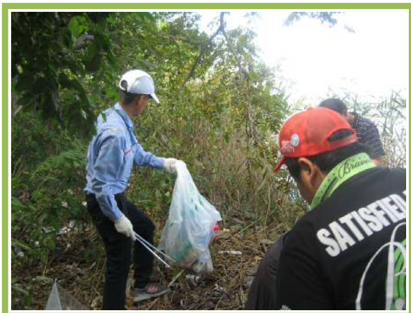
▼実施日:10月3日(金) 実施会場名:西新井橋上流右岸 主催団体名:日本KFCホールディングス(株) 参加人数:5名