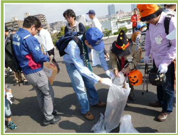
▼実施日:10月26日(日) 実施会場名:荒川鉄橋(荒川運動公園付近~三領水門) 主催団体名:川口市建設部建設管理課 参加人数:4名