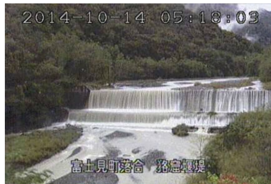
貉窟砂防堰堤（富士見町） （10月14日 5時18分頃）