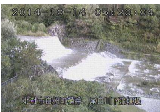
尾白川下流砂防堰堤（北杜市） （10月14日 5時28分頃）