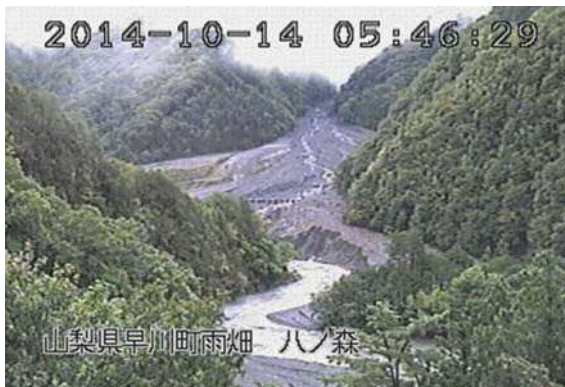
雨畑川・御池ノ沢合流付近（早川町） （10月14日 5時46分頃）