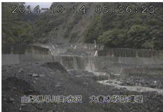
大春木川砂防堰堤（早川町） （10月14日 5時36分頃）