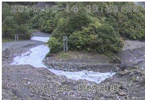
雨畑川・御池ノ沢合流付近（早川町） （10月14日 5時46分頃）