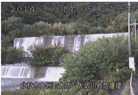
大武川砂防堰堤（北杜市） （10月14日 5時37分頃）