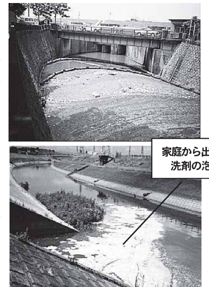
上：坂川（昭和63年：赤坂付近） 下：坂川（平成2年：富士見橋付近）

■国土交通省管理の坂川区間は、流山市野々下～松戸市新松戸6丁目（新松戸西小学校の辺り）までです。