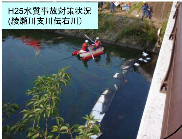
H25水質事故対策状況 (綾瀬川支川伝右川)

※中川・綾瀬川で発生した水質事故の内、中川出張所管内で発生した水質事故は事務所全体で発生した水質事故の43%でした。