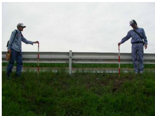
雨水による堤防浸食状況