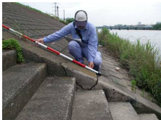
コンクリートの破損状況

本格的な台風シーズンを前にして中川下流出張所管内の堤防を職員が徒歩で点検を実施しました。一部コンクリートの破損や堤防の浸食など不具合箇所も発見されました。不具合箇所については、応急措置を行った後、経過観察すると共に、必要な補修を計画的に実施していきます。