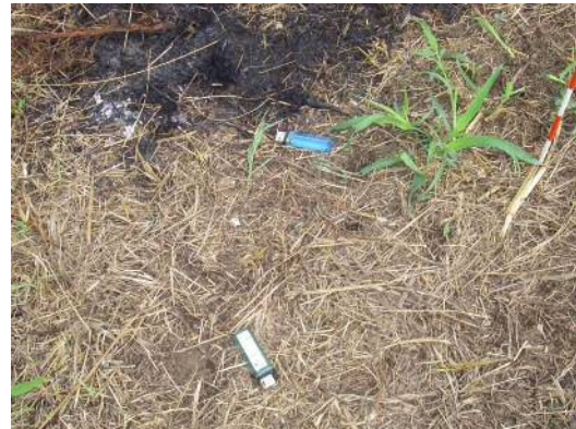
点火に使用したと思われるライター