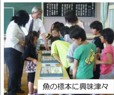
魚の標本に興味津々