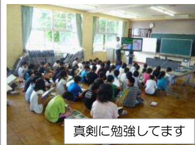
真剣に勉強しています

下館河川事務所では、鬼怒川・小貝川に関する様々な出前講座があります。興味のある方は、事務所ホームページをご覧ください。