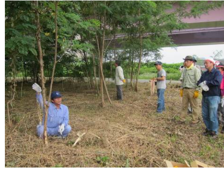
ハリエンジュ幼木巻き枯らし体験