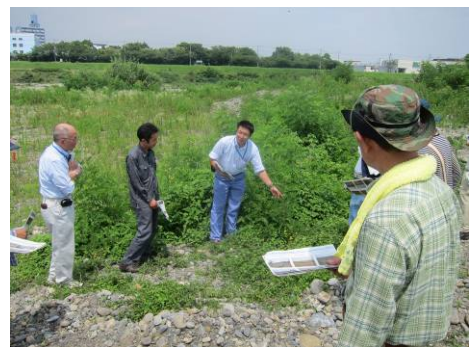
自然再生の取組み説明

自然再生の取組み（外来樹林対策、人工利用地対策等）に関して説明があった。平成 24 年度にハリエンジュ伐採を実施した区域では、再繁茂が見られたため今年度 5 月に伐根を実施している。参加者からはハリエンジュ伐採時に出た土砂の利用や自然再生後の環境について質問が挙がった。