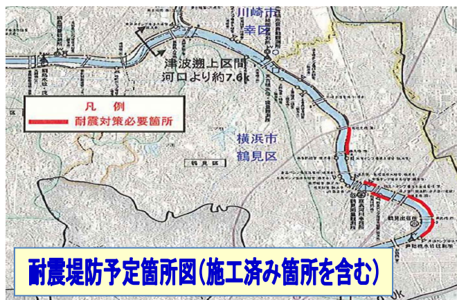
耐震堤防予定箇所図(施工済み箇所を含む)