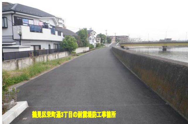
鶴見区栄町通3丁目の耐震堤防工事箇所