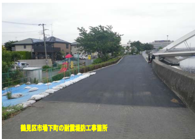
鶴見区市場下町の耐震堤防工事箇所

横浜市鶴見区の市場下町、栄町通3丁目の2箇所で行われていた耐震堤防工事が完了しました。