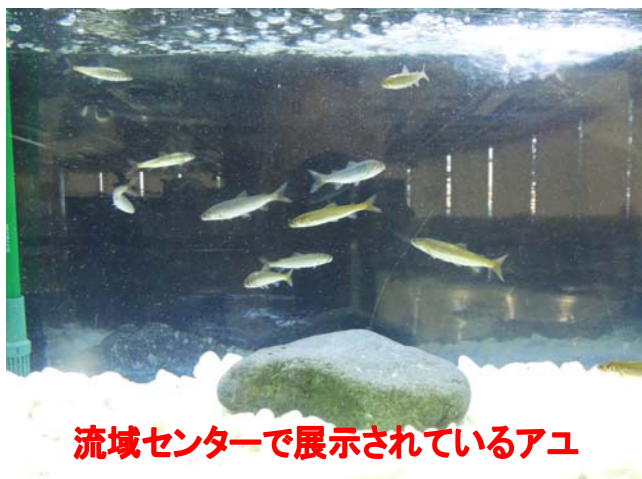
流域センターで展示されているアユ