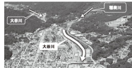
福寿川からの土砂流出を抑え、日光市街地の氾濫を防ぐ大谷川床固群

川の流れをゆるやかにしたり、真っすぐに整えたりして流れを安定させ、雨が降っても氾濫しにくくする施設です。また川の土砂が削られるのを防ぎ、土砂災害が起きにくくします。