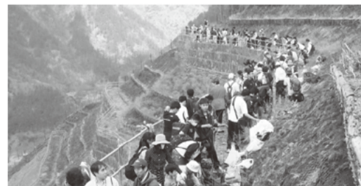
ポランディアによる山腹工の植樹活動

荒れた山肌に柵や壁を設置し、植樹などが行えるよう整備した施設です。木々の生長と森林の創出を促しながら土砂の流出を防ぎ、土砂災害の発生を防ぎます。