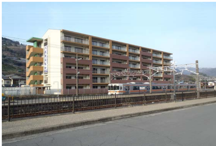
町営定住促進住宅 サンライズやまきた

平成 24 年 12 月～平成 26 年 3 月で設計・建設を行い、同年 3 月末から入居を開始しました。