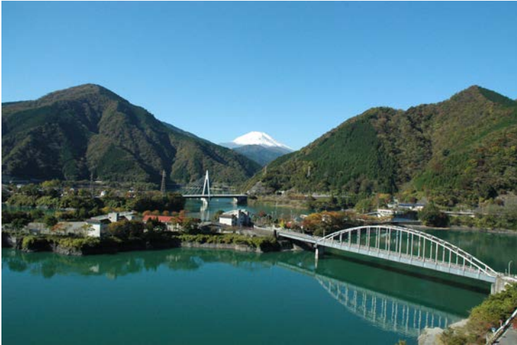
富士山を背景にした丹沢湖