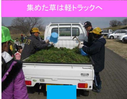
集めた草は軽トラックへ