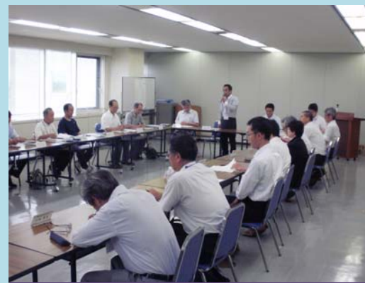
河川愛護モニター説明会の様子