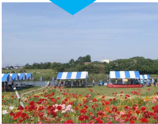
写真は昨年撮影「花とふれあい祭り」

当日は、初夏にポピーが咲き誇り、楽しい「花とふれあい祭り」を夢見て、約五十名が草取り交流会に参加しました。