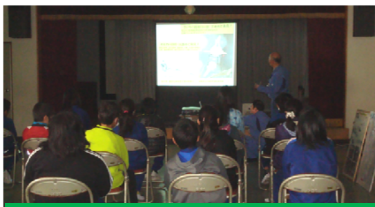
小学校の社会科の授業