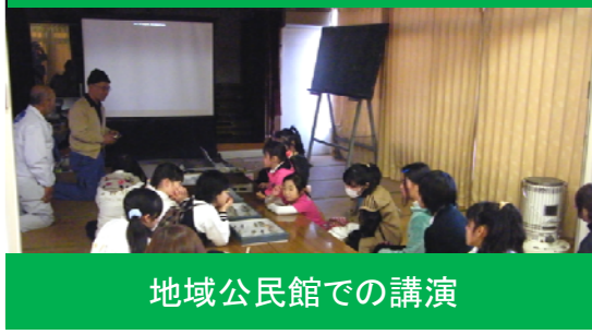
地域公民館での講演