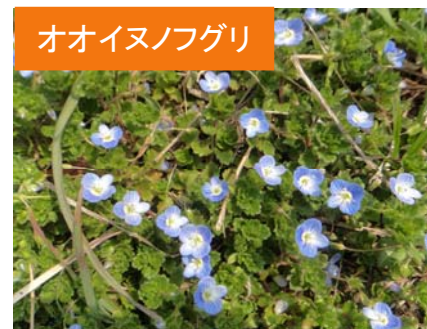
オオイヌノフグリ