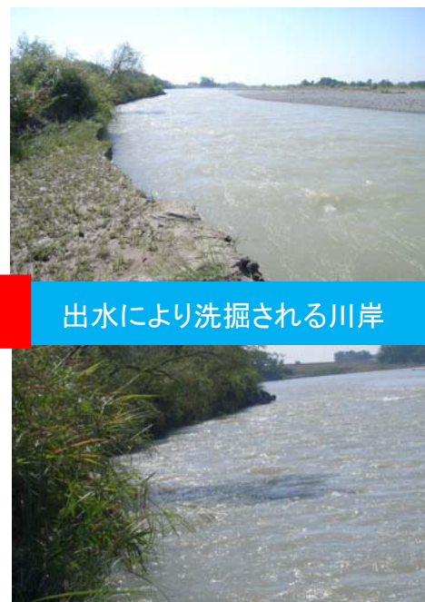
出水により洗掘される川岸

各所において、河川工事を実施しており、河川利用者の方には、ご不便をおかけしますが、ご理解・ご協力をお願いします。