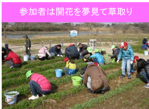
参加者は開花を夢見て草取り

三月九日(日)、下妻市大形橋上流河川敷(鬼怒フラワーライン)において、花と一万人の会主催による草取り交流会が開催されました。