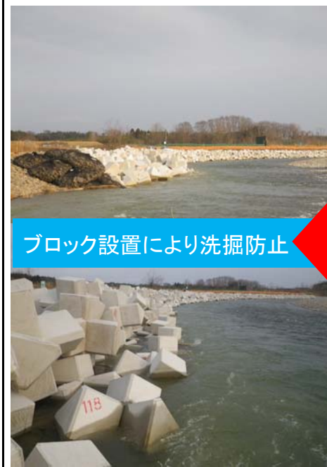
ブロック設置により洗掘防止