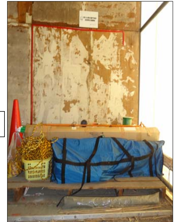
本田航空さんの倉庫への備品の仮置き状況