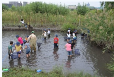
水辺の生き物にふれあう様子