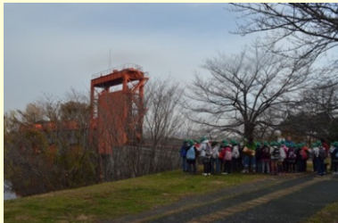
旧岩淵水門見学の様子