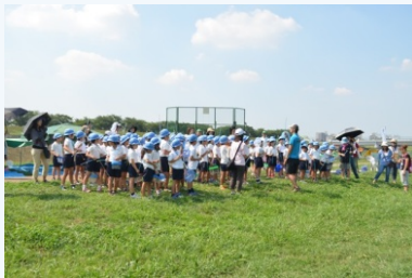
子どもの水辺にて説明の様子