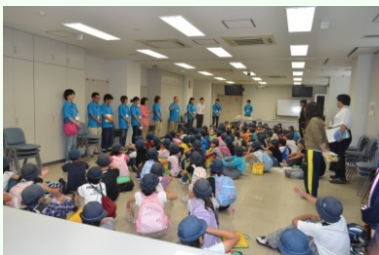
アモアホールにて挨拶の様子