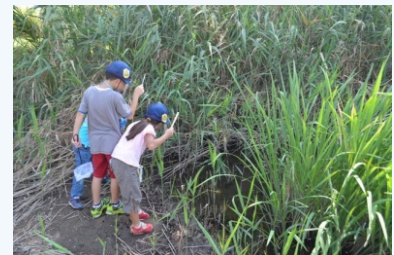
クロベンケイガニを探している児童