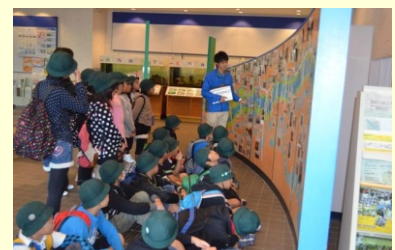
荒川知水資料館内見学の様子