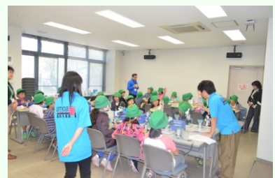
奥：水質検査の様子 手前：微生物観察の様子