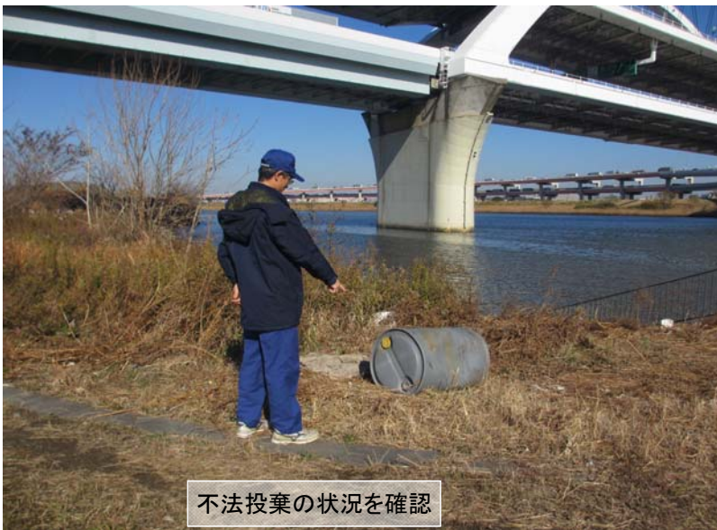
不法投棄の状況を確認