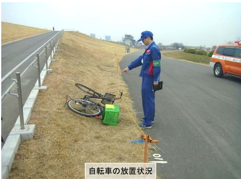
自転車の放置状況