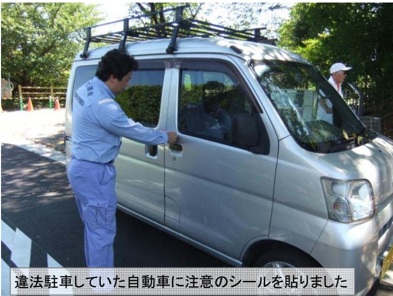
違法駐車していた自動車に注意のシールを貼りました