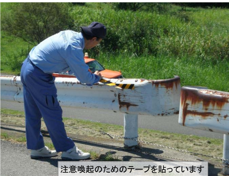
注意喚起のためのテープを貼っています