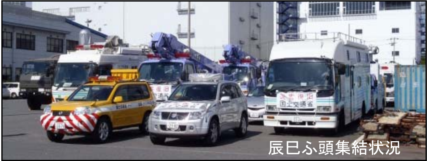
関東技術事務所より派遣