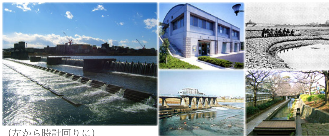
(左から時計回りに)

左岸からみた「二ヶ領宿河原堰」／二ヶ領せせらぎ館／大正初期の蛇籠堰／昭和24年に完成した旧「二ヶ領宿河原堰」／二ヶ領用水 (写真-H17.1撮影)