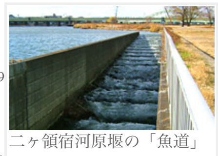
二ヶ領宿河原堰の「魚道」

平成5(1993)年5月28日、建設省は「多摩川河道検討委員会」を設置、堰管理者の川崎市、河川管理者の建設省京浜工事事務所、大学など関係機関や地域住民団体の方々などと、2年間に9回の委員会を開き、二ヶ領宿河原堰の改築方法などの検討をくり返しました。