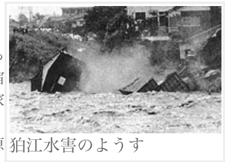
狛江水害のようす

幾多の困難を乗り越えてコンクリート制になった二ヶ領宿河原堰でしたが、このコンクリートの固定部が、大災害の要因の一つとなってしまったのです。