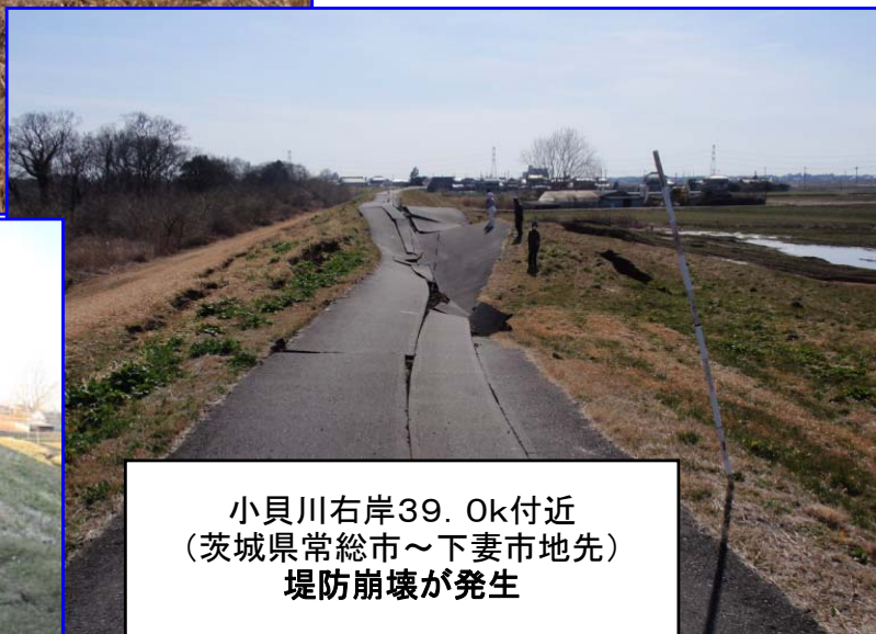
小貝川右岸39.0k付近 (茨城県常総市～下妻市地先) 堤防崩壊が発生