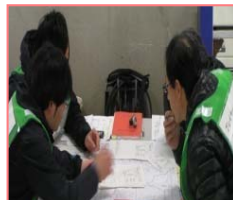
参加機関の各プレイヤー訓練状況