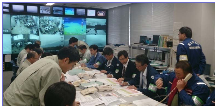
コントローラー訓練全景