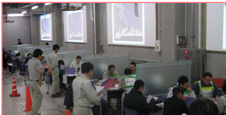
プレイヤー訓練全景