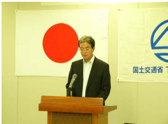
表彰式にて挨拶する富岡下館河川事務所長