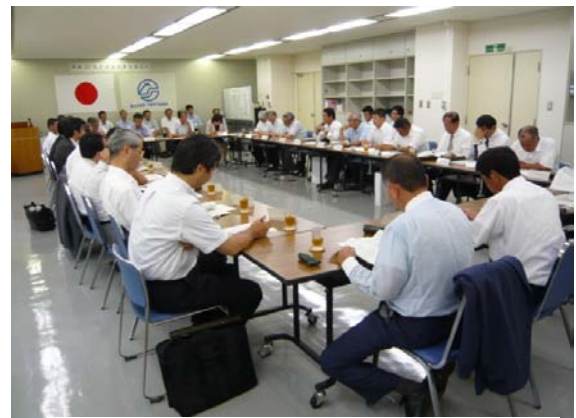
『意見交換会』の様様