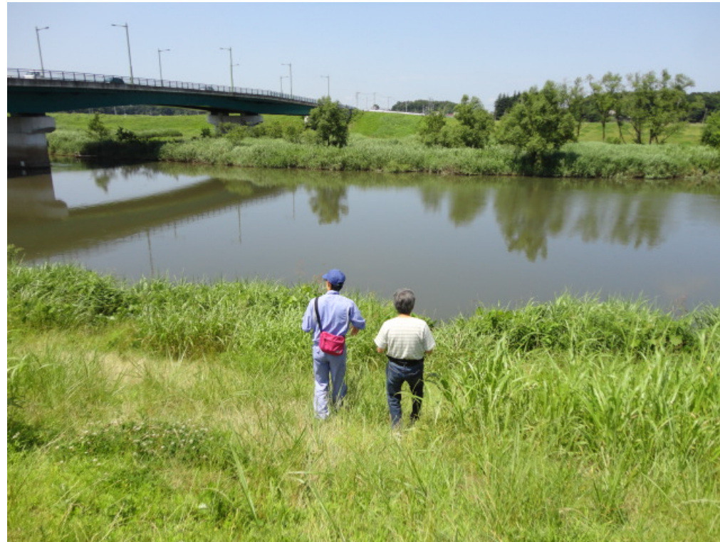
河川愛護モニターとの点検状況