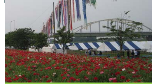
花とふれあいまつり