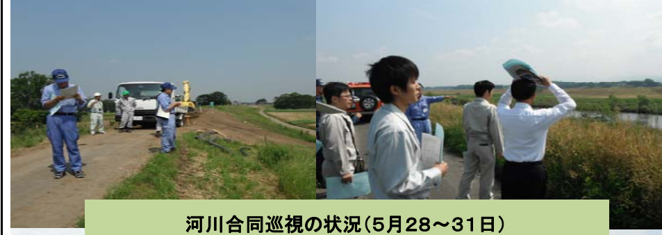
河川合同巡視の状況(5月28~31日)