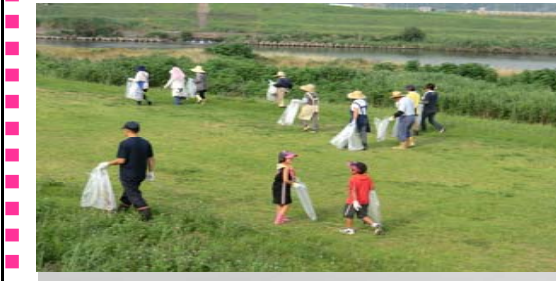
昨年度の実施状況

鬼怒川・小貝川流域ネットワーク会議では、毎年河川愛護月間(7月)の第二土曜日を統一日として、地域と一体となった良好な河川環境の保全・再生を目指し、堤防や河川敷に投棄されたゴミの一斉清掃を流域の自治会や子ども会、企業等の皆様と共に実施しています。