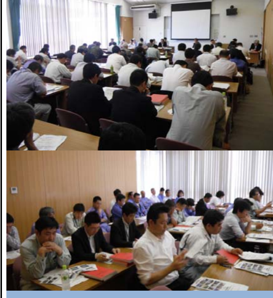
水防連絡会の状況

平成二十四年五月二十八日(月)から五月三十一日(木)にかけ下館河川事務所では洪水等に際して水防上、特に注意を要する箇所(今年度においては、東日本大震災の被災復旧箇所などをはじめとする重要水防箇所)について水防管理団体と共に巡視を行い、洪水時等に迅速、的確な水防活動が行なわれるよう現地において確認を行い出水期に備えています。