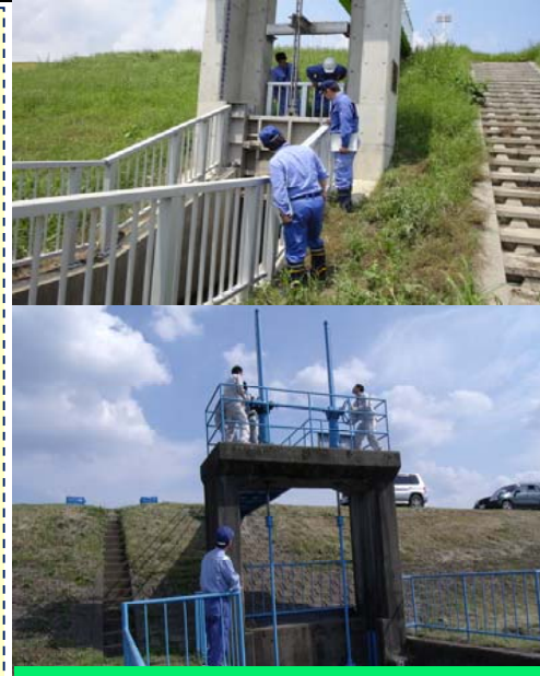
排水樋管のゲート開閉状況確認

今年度は、①昨年被災し、指摘した工作物についての対応がなされているか。②出水への対応について具体的に確認し、対策が必要な箇所については回答を求める。の以上2点を重点に出水期に備え履行検査を実施しました。